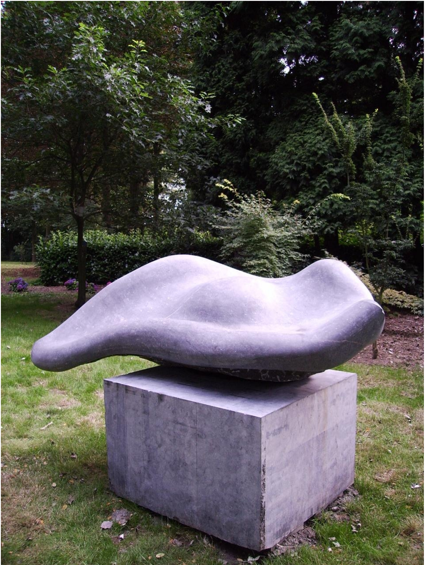
Nata nel mare