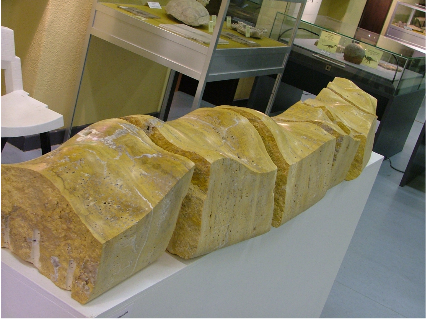
Ondulations cadencées (Bernissart)