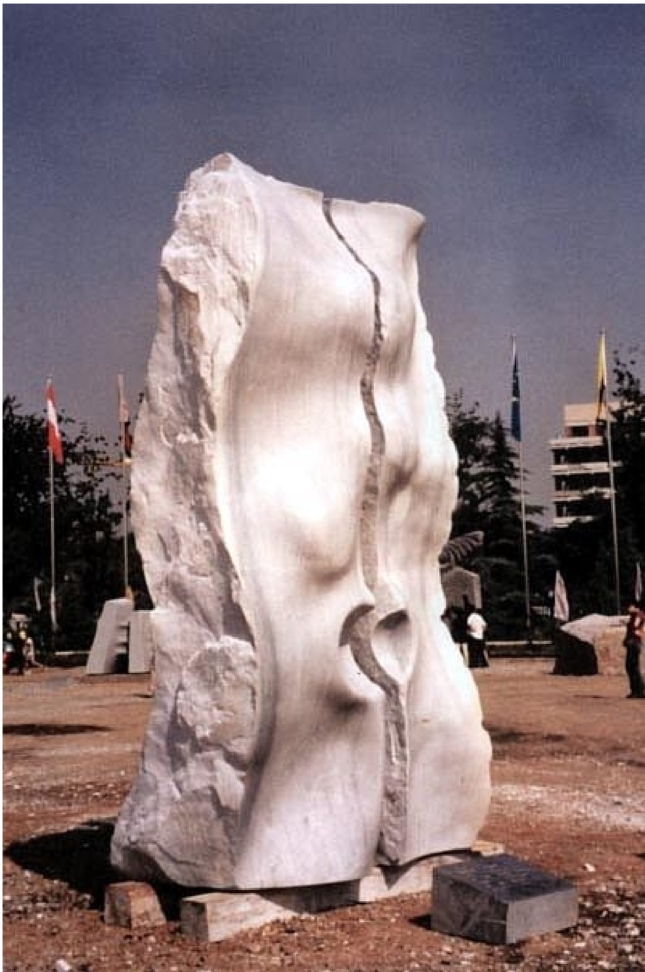
Morphologie II (Symposium 2002 Peking – standplaats: Olympisch Park Peking)