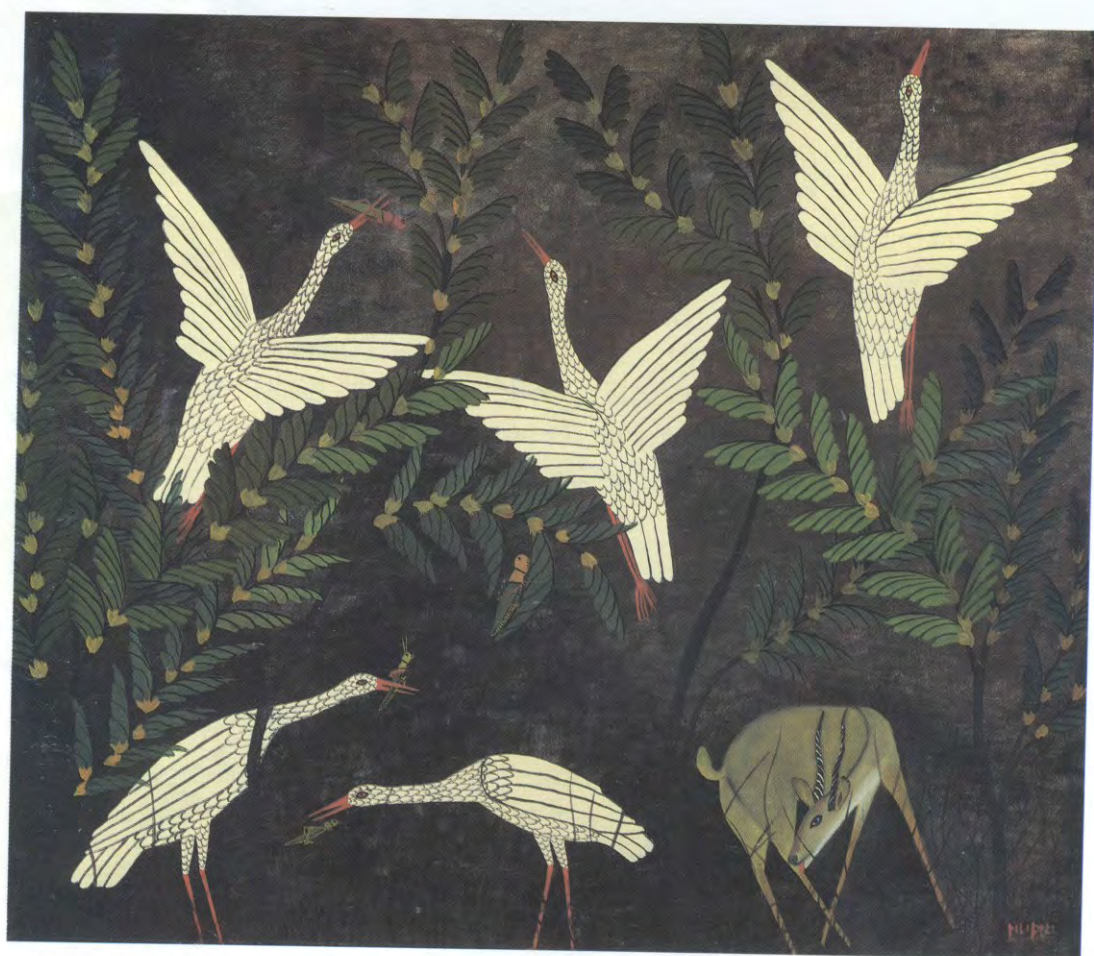
Grote witte vogels, olie op doek, s.d., 101 x 118 cm, verzameling Museum-Tervuren (A3363)