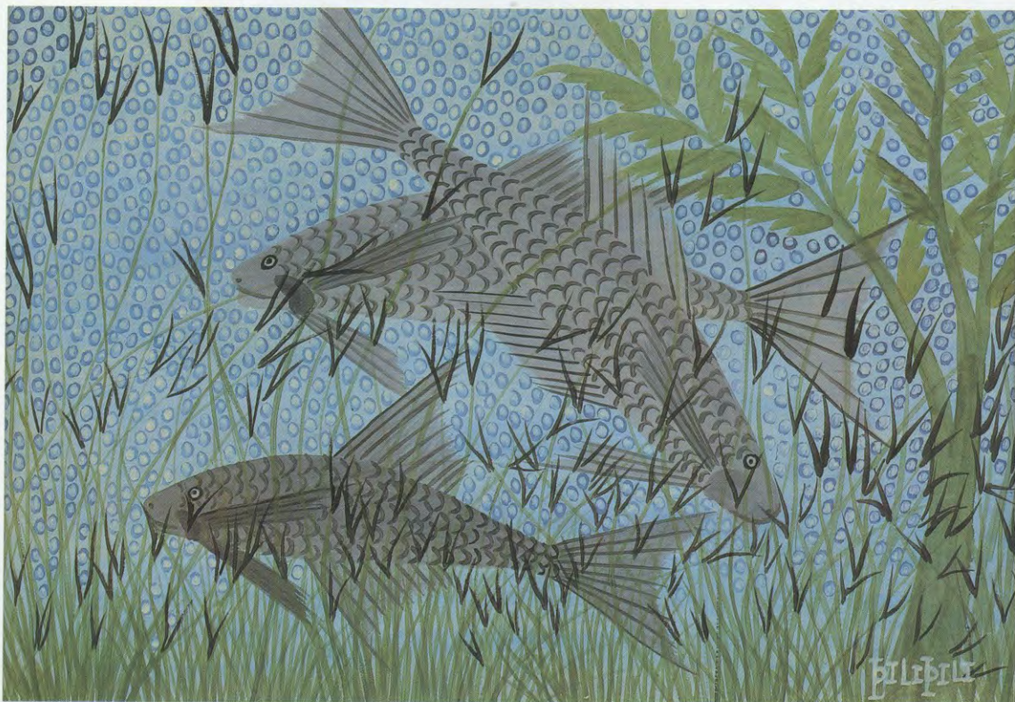
Grijze vissen, gouache op papier, s.d., 36,5 x 52,5 cm, verzameling Museum-Tervuren (A755)