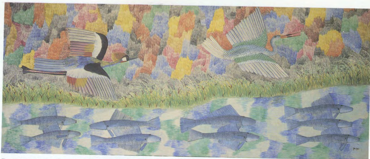
De vissen en de kraanvogels, acryl op doek, s.d., 87 x 206 cm, verzameling van Bever