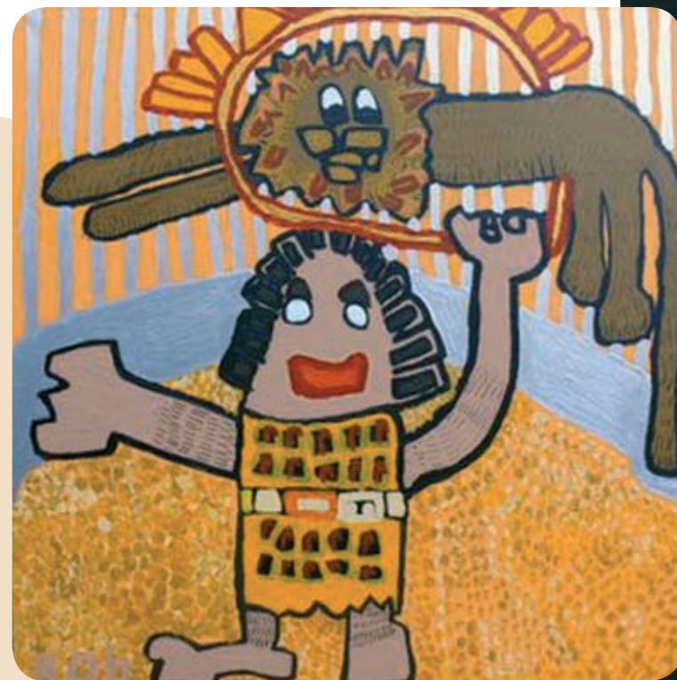
De dompteur, Rik Waterval, Ut Glaashoes